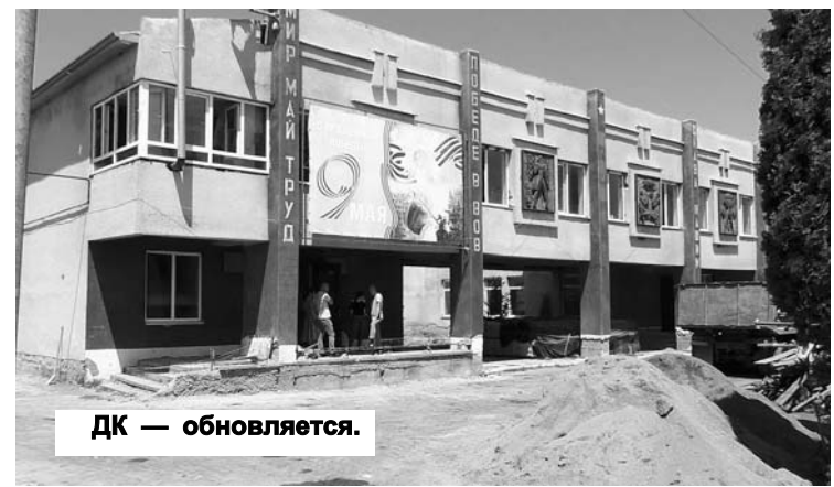
ДК — обновляется.