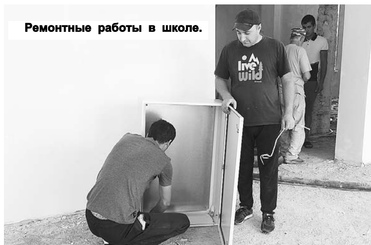
Ремонтные работы в школе.